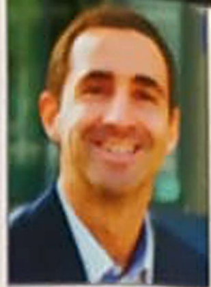
Por: Dr. David Rasteiro CIRURGIÃO PLÁSTICO